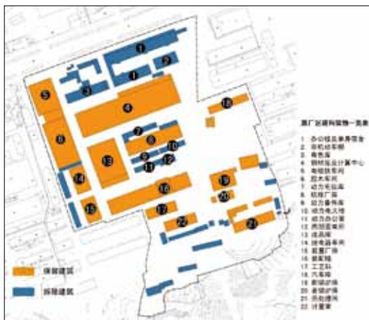
图1 尺度变化对比图