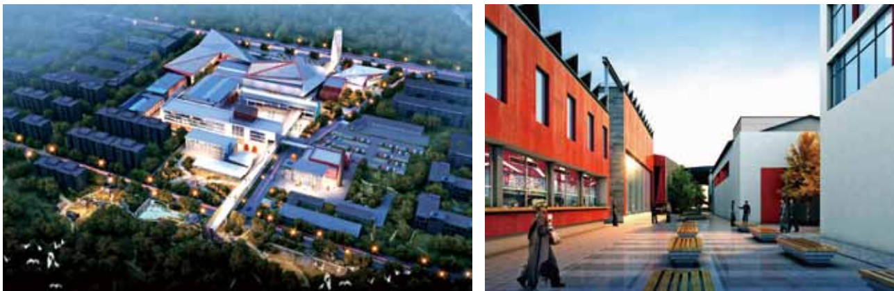
图 6 天水工业博物馆鸟瞰