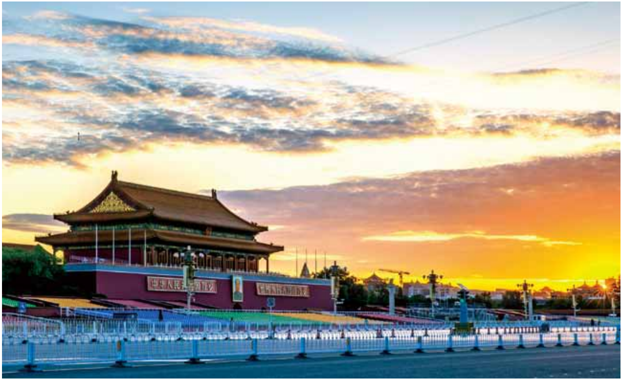
《天安门日出》科技公司 武旭升