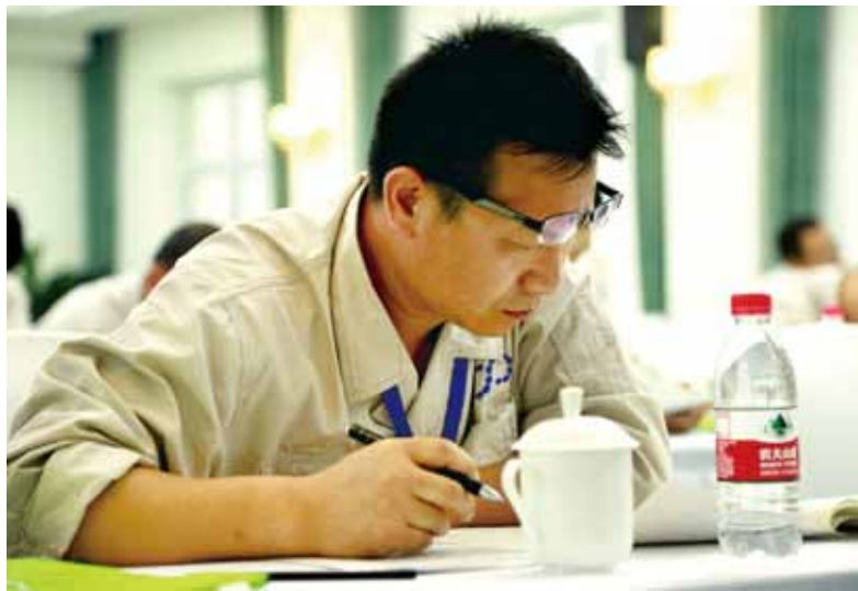
23日、24日，60名参赛选手分别参加了维修电工与焊工理论与实操考试。会议代表观摩了竞赛实际操作考试。