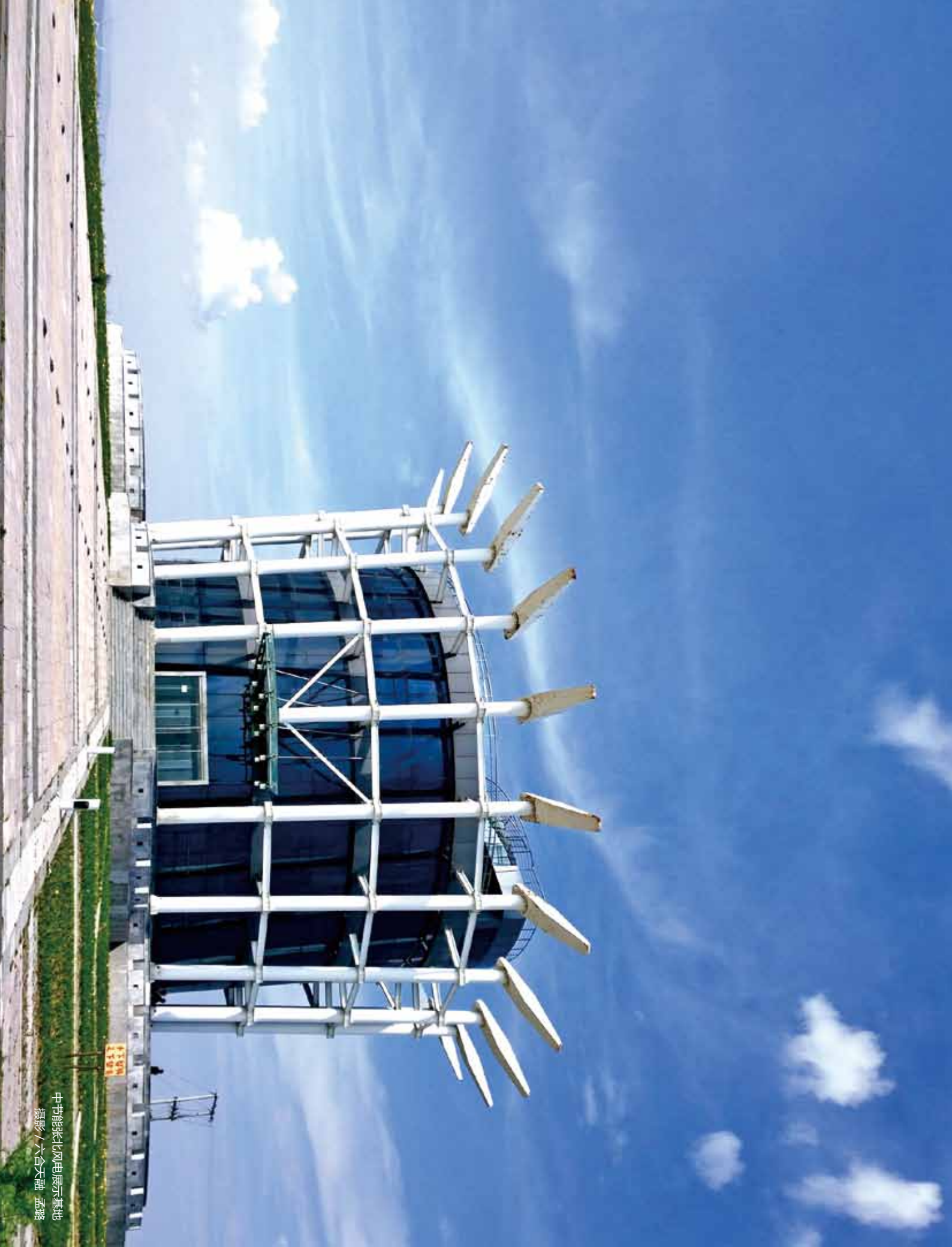
中节能张北风电展示基地