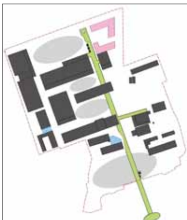
图2 馆区参观游览路线