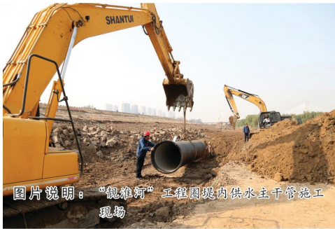
图片说明：“靓淮河”工程圈堤内供水主管道施工现场

直至11月27日下午大会结束后，蚌埠中环作为最后撤场的保障单位，圆满完成了本次第二届国际新材料产业大会供水保障任务。（本报记者）