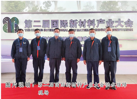
图片说明：第二届国际新材料产业大会供水保障现场

（接一版）组督促整改。在主会场古民居博览园迎宾馆，保障组在内部管道上安装应急供水变频增压机泵，并对古民居博览园迎宾馆双路供水状况进行检查。